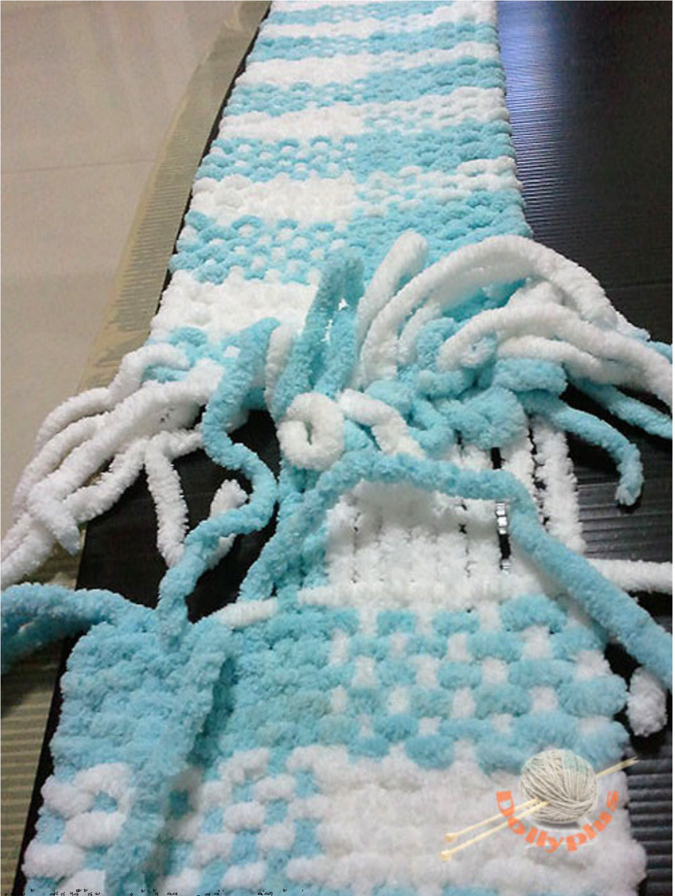
สวัสดีค่ะทุกคนที่เพิ่งได้เป็นนักทอผ้าด้วยไหมพรมอุ้งครั้งแรกๆ ซึ่งจริงๆ ค่ะ