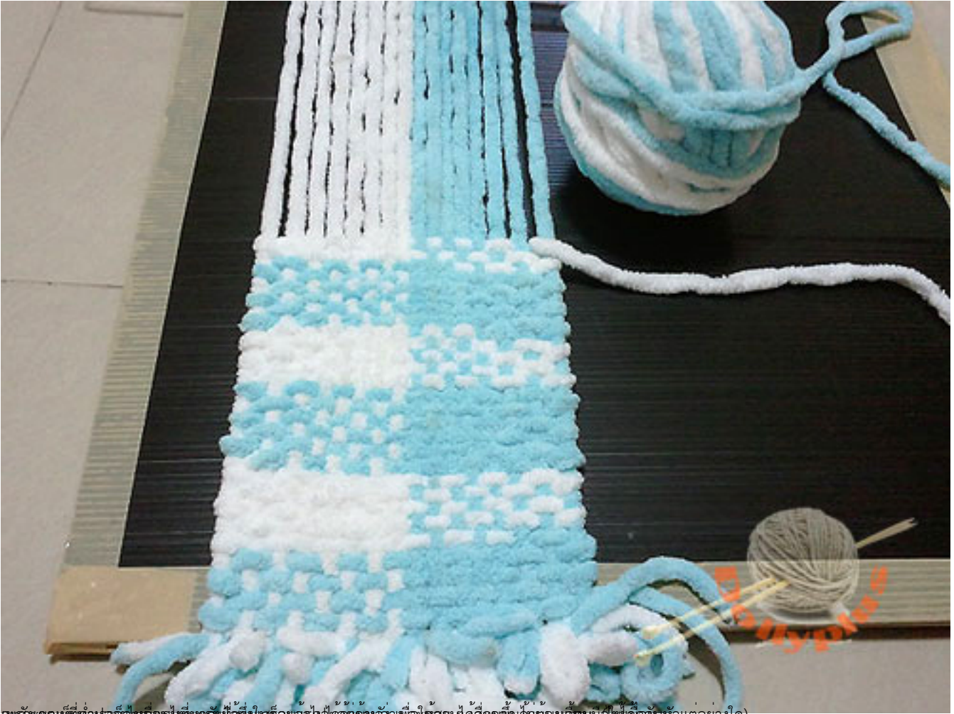
ลักษณะที่เข้าปกก็เหมือนกันคือถักด้วยสีฟ้าและสีขาวแล้วไปเย็บหูหิ้วที่หัวและปลายก็ได้เหมือนกันแต่ขยับเย็บหูหิ้วเป็นสีอื่นก็ได้